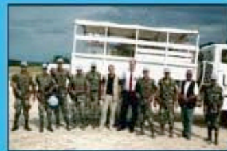
P.S.I. en Haïti

High risk management Executive protection Homeland security Security training Investigations