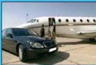
Prestige & Qualité